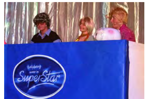
„Iselsberg sucht in Superstar“ – so lautete der erste Beitrag des Kirchenchores.