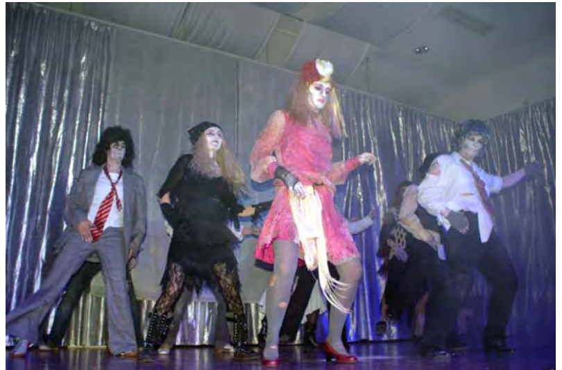
Die Turnerinnen der Sportunion begeisterten mit der Nummer „Thriller“ von Michael Jackson