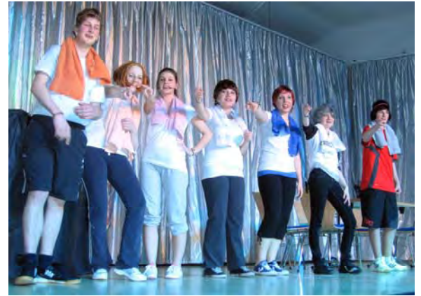
Die Beiträge der Landjugend „Rotkäppchen“ und „die Volleyballerinnen“ sorgten für viele Lacher unter dem Publikum.