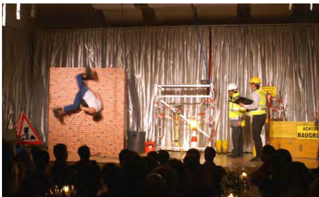
Ein riesiger technischer Aufwand und gute sportliche Verfassung waren für den Beitrag der Feuerwehr „Baustelle – die Fortsetzung“ erforderlich